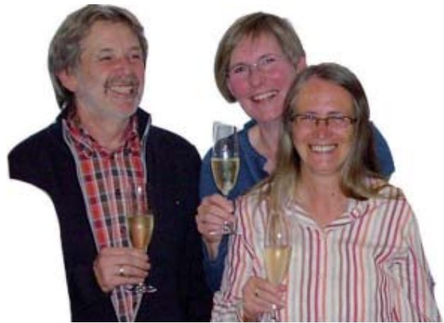
Von links nach rechts:

Doch damit der Wünsche nicht genug: Der neue und gleichzeitig alte Vorstand wünscht Ihnen, unseren Mitgliedern, Förderern und Freunden, einen guten Ausklang des alten Jahres, ein Weihnachten mit Ruhe und Besinnung und einen mutigen Schritt in ein neues, spannendes Jahr.